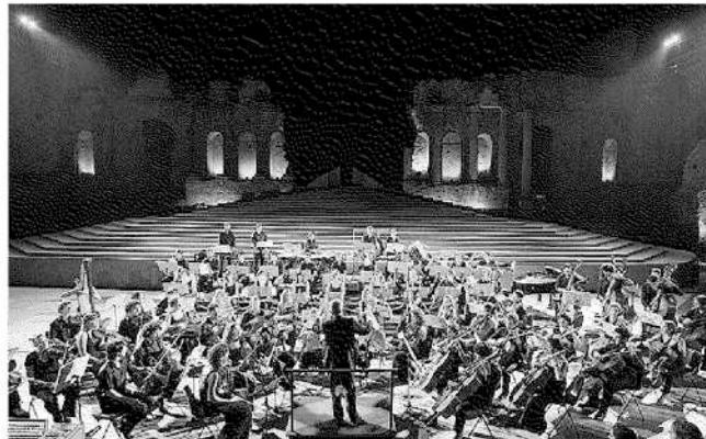
L'Orchestra durante il concerto al Teatro Antico di Taormina